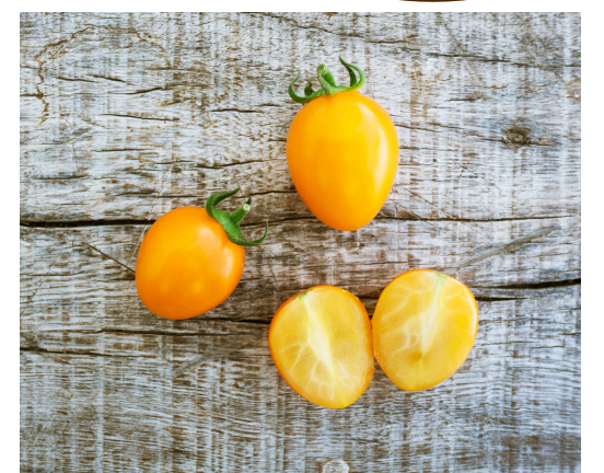
TOMATE CERISE JAUNE

LES 4 "CLASSIQUES" DES POTAGERS : COURGETTE, POTIMARRON, COURGE MUSQUÉE DE PROVENCE ET BUTTERNUT