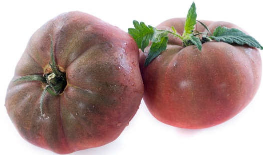
NOIRE DE CRIMÉE